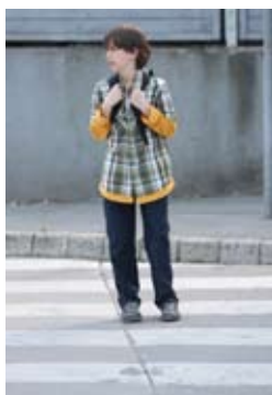
6. Na sredini ceste še enkrat pogledam na desno.