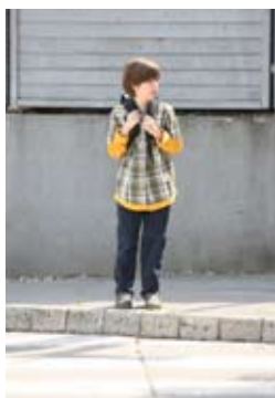
4. Še enkrat pogledam levo