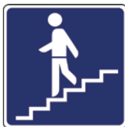
Podzemni prehod za pešce