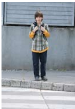
1. Ustavim se na robu pločnika

Potem, ko se prepričamo, da se otrok zna ustaviti ob robu pločnika in opazovati promet, začnemo z najtežjim delom, prečkanjem ceste. Prva prečkanja naj bodo na ozki, neprometni cesti. Poseben problem je, ker otrok ni sposoben ugotoviti razdalje in hitrosti vozil. Zato ga navajamo na to, da prečka cesto le, če z obeh strani ne prihaja nobeno vozilo ali takrat, ko voznik ustavi in mu jasno pokaže, da lahko prečka cesto.