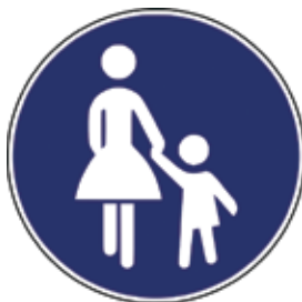
Steza za pešce

Otroci bi morali poznati predvsem prometne znake, ki pešce obveščajo o varni hoji, jim zapovedujejo ravnanje ali prepovedujejo hojo.