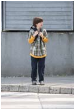
2. Pogledam na levo