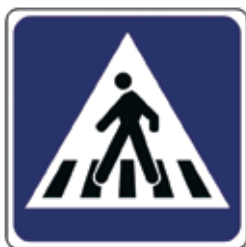
Prehod za pešce