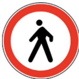
Prepovedano za pešce