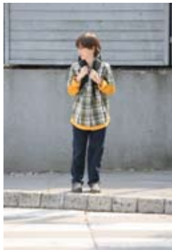
3. Pogledam na desno