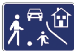
Območje umirjenega prometa

Policist je na cesti zato, da otrokom pomaga in jih varno usmerja v prometu. Grožnje, da ga bo videl ali celo kaznoval policist, če naredi kaj narobe, zato niso primerne.