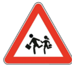
Otroci na cesti

Prometni znaki s svojimi barvami in simboli otroke vedno pritegnejo. Brez težav se naučijo njihova imena, več problemov pa imajo pri tem, kako je potrebno ravnati. Nekaj znakov otroke izredno moti in jih razumejo popolnoma narobe. Simbole si razlagajo po svoje in tako tudi ravnajo. Najbolj znan znak, ki spodbuja otroke k napačnem ravnanju, je znak Otroci na cesti, ki opozarja voznike, da prihajajo na območje, kjer so na cesti pogosto otroci. Zaradi simbola dveh otrok v teku pa ga otroci lahko razumejo tako, da je treba pri tem znaku steči čez cesto.